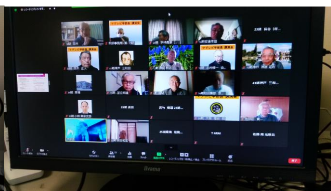
38名が参加されました。