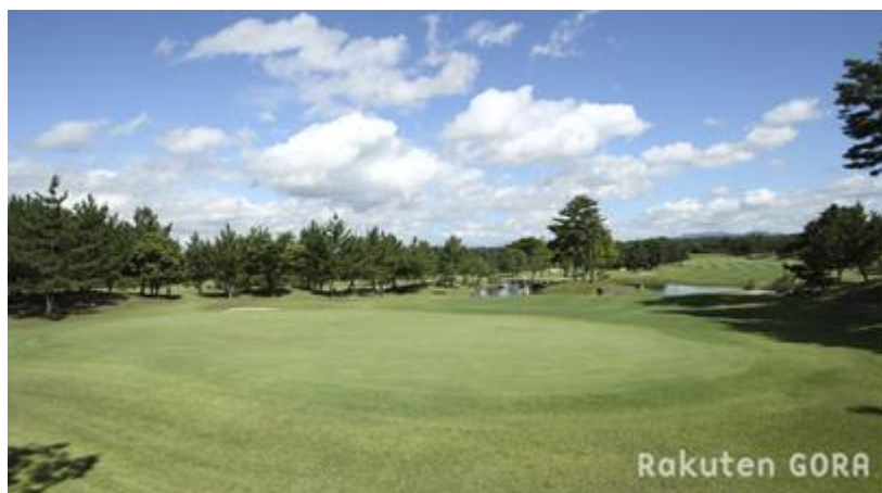
OLDコース 11番グリーン

その他 : 1) メールで案内を受けた方は、 必ず出欠の返信メールをお願いします。 2) 郵送で案内を受けた方は、 必ず出欠の返信ハガキをご投函願います。