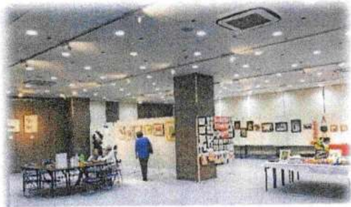
「趣味の作品展」全景 (入口より奥を望む) 左に草炎さんの水墨画が見えます