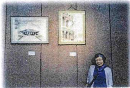
草炎さんと水墨画 唐招提寺 (左) とコロッセウム (右)